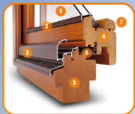
Przekrój przez okno (widok od zewnątrz)